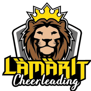
Kuva 1. Seuran tunnus. Kuva 2. Cheerleading tunnus